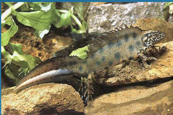
Tritone crestato italiano