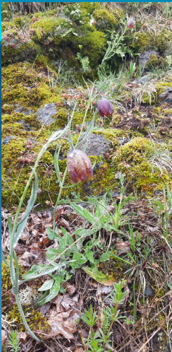
6130: flora delle ofioliti